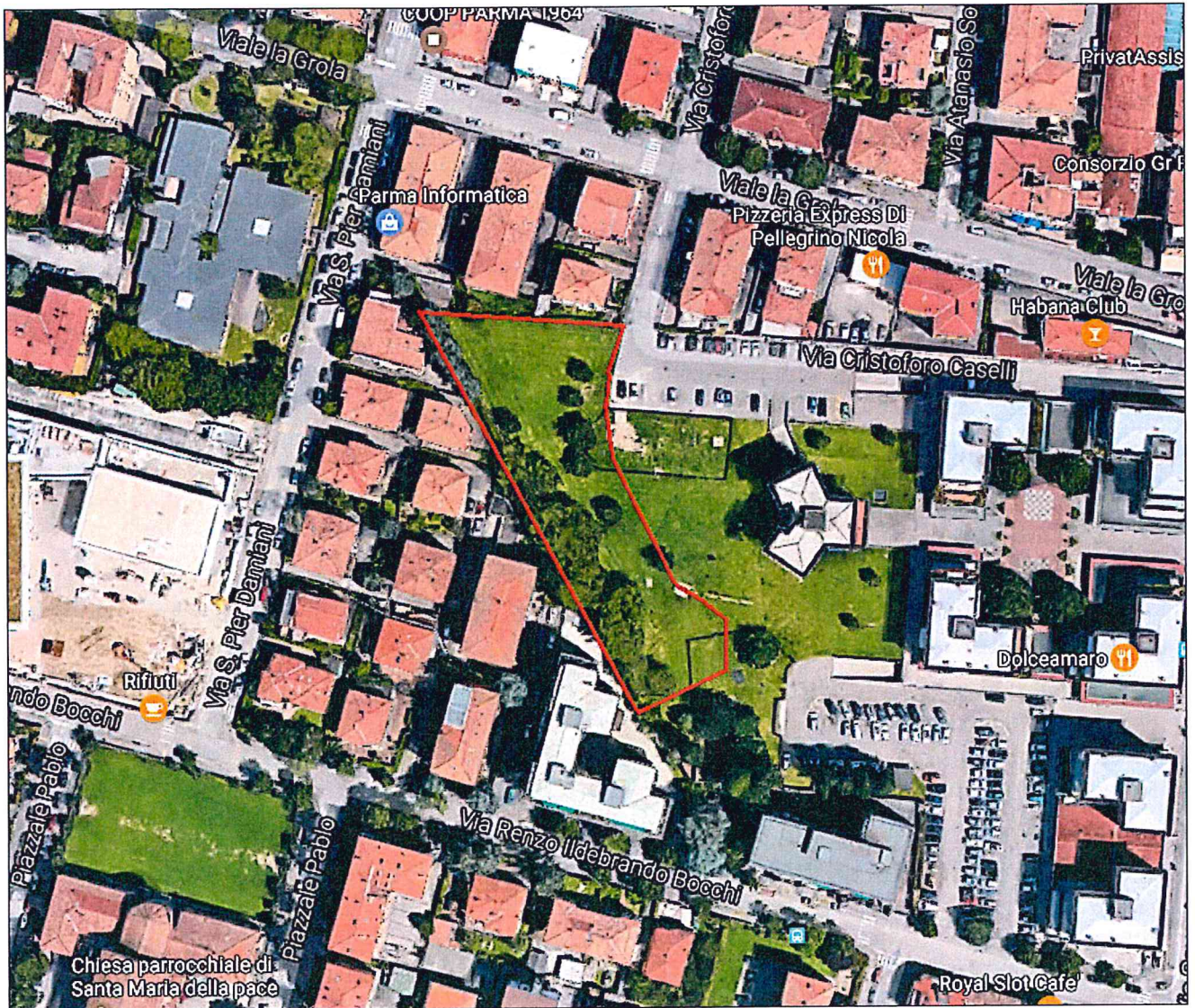
Inquadratura aerea dell'area oggetto di stima